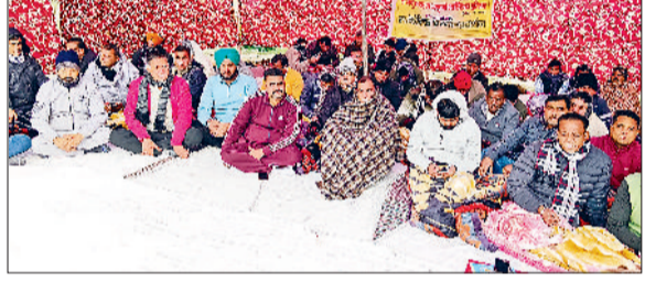
कैथल। हड़ताल के दौरान धरना देते पटवारी।

हुए हैं। पटवारियों तथा कानूनगो ने कहा कि एक सप्ताह से बर्कित दिनों में पटवारी-कानूनगो हड़ताल पर है। सरकार को समय भी दिया गया। बावजूद इसके सरकार ने कोई बातचीत नहीं की। जिसके चलते हड़ताल को 12 तक बढ़ा दिया गया है। अगर सरकार अवधी तक मांगों पर विचार नहीं करती तो हड़ताल अनिश्चितकाल में बदल जाएगी।