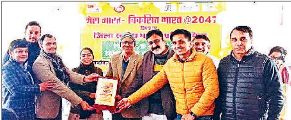
कैथल। प्रतिभागियों को सम्मानित करते अधिकारी।