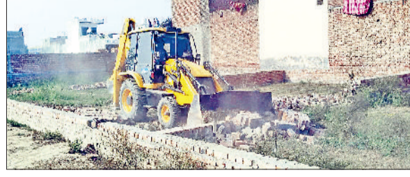
जींद। अवैध कालोनी में भरी नींव उखाड़ती जेसीबी मशीन।