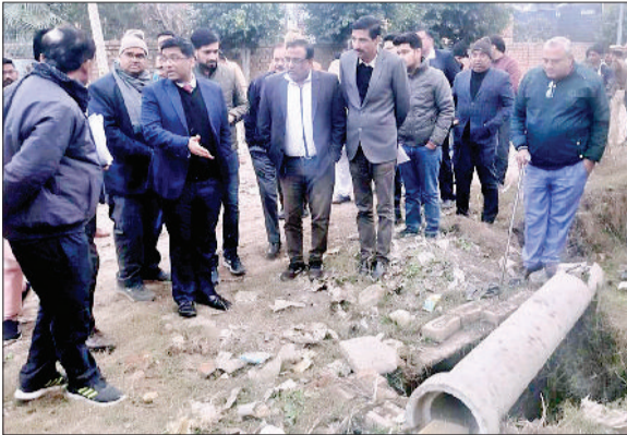
गंदगी को देख तुरंत प्रभाव से सफाई के आदेश देते डीसी।

इंडस्ट्रियल एरिया में मौजूद गंदगी को देख तुरंत व्यवस्था बनाने के लिए आदेश: उपायुक्त ने जीद के औद्योगिक क्षेत्र की वहां सुविधाओं एवं समस्याओं का स्वयं जायजा लिया। इस दौरे के दौरान उन्होंने सड़क, अंकुर स्टील इंडस्ट्री सहित आसपास के क्षेत्र का