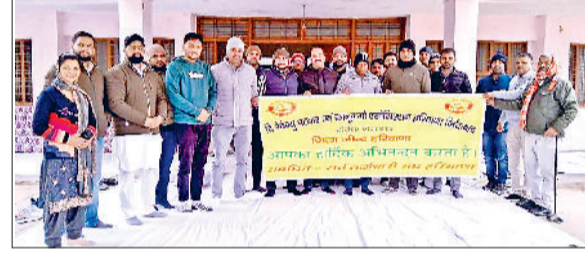
जींद। रोष जताते पटवारी।