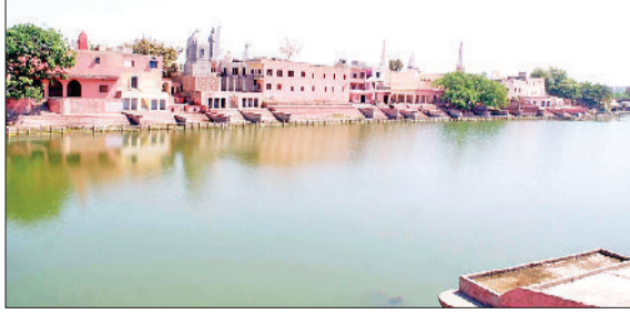
जीद। पिंडारा तीर्थ, जहां श्रद्धालु आज श्रद्धा की डुबकी लगाएंगे।

वर्ष 2024 की पहली अमावस्या (पौष अमावस्या) वीरवार को पड़ रही है। धार्मिक मान्यताओं में पौष अमावस्या को विशेष महत्व दिया गया है। पौष अमावस्या जहां पितरों को खुश करने के लिए विशेष महत्व रखती है वहीं काल संपद दोष भी इसी दिन दूर किया जा सकता है। पौष अमावस्या के दिन स्नान दान मुहुर्त सुबह पांच बजकर