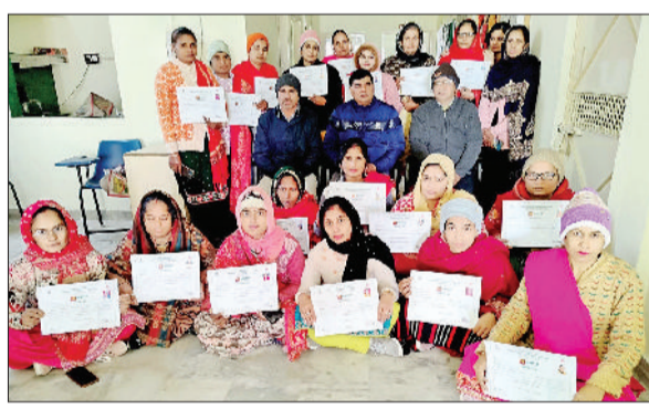
जीद। प्रशिक्षार्थियों को प्रमाण पत्र वितरित करते हुए मुख्यातिथि।

पंजाब नेशनल बैंक ग्रामीण स्व रोजगार प्रशिक्षण संस्थान द्वारा चलाए जा रहे दो दिवसीय एक गांव एक बैंक मित्र रिफ्रेशर ट्रेनिंग व शामलो गांव में चलाए जा रहे छह दिवसीय सामान्य उद्यमिता विकास प्रशिक्षण कार्यक्रम का समापन हुआ। यह प्रशिक्षण कार्यक्रम ग्रामीण विकास मंत्रालय के निर्देशानुसार चलाए जा रहे हैं। इन दोनों प्रशिक्षण कार्यक्रमों में 49 प्रशिक्षार्थियों ने प्रशिक्षण प्राप्त किया। प्रशिक्षण के उपरांत एक गांव एक बैंक मित्र के प्रशिक्षार्थी किसी भी बैंक से बैंक मित्र के लिए आवेदन करके बैंक