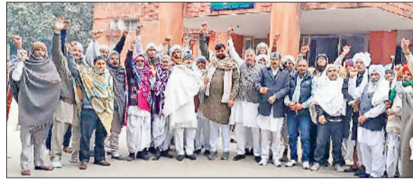
पूंडरी। मांगों को लेकर सरकार के खिलाफ नारेबाजी करते किसान।