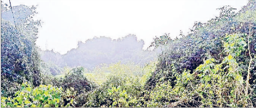
जीद। दिन के समय खिली धूप।

एक पखवाड़े बाद दिन में खिली धूप, ठंड से कुछ हद तक मिली निजात: नव वर्ष के