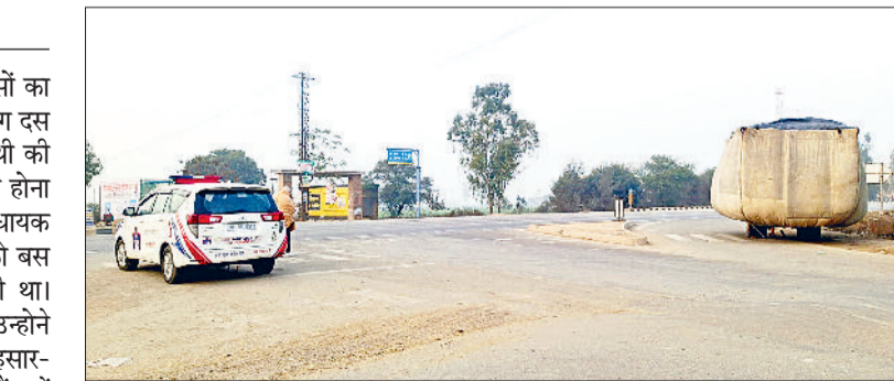
नरवाना। हथो गांव का बस स्टैंड।