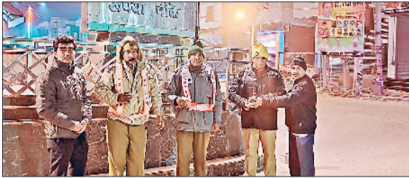
जींद। नाके पर तेनात पुलिसकर्मी गरम दूध पीते हुए।

के लिए पुलिसकर्मियों की रात के समय नाकों पर ड्यूटी भी लगी रहती है। बरसात हो या ठंड जवान ड्यूटी पर मुस्तैद रहते हैं लेकिन बीते कुछ