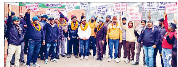
नरवाना। एक दिवसीय भूख हड़ताल पर देते हुए उत्तरीय रेलवे मजदूर युनियन।