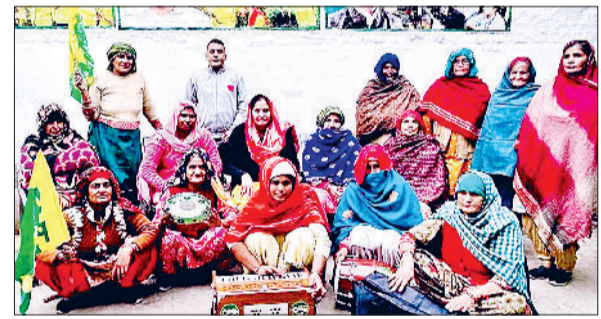
उषाना। डूमरखा खुर्द की भजन मंडली डिप्टी सीएम द्वारा भेजे गए भजन-कीर्तन के सामान के साथ।